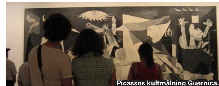
Picassos kulturmålning Guernica.

Stort konstmuseum som visar den stormrike baronen Thussen-