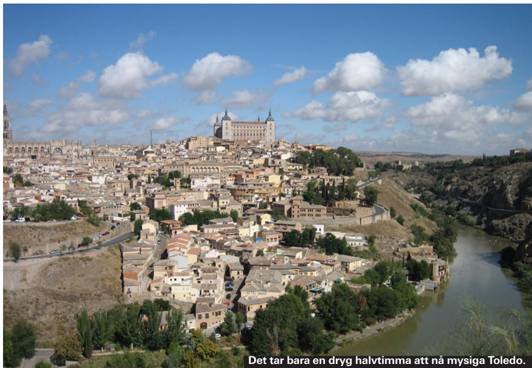
Det tar bara en dryg halvtimme att nå mysiga Toledo.