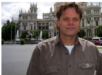
Text &amp; foto: THOMAS GUSTAFSSON

Så mitt råd är: Ta det lugnt en dag. Stanna till. Sitt på ett kafé. Häng på en tapasbar. Hämta krafter i en park. Låt staden komma till dig. Det är kanske det bästa sättet att lära känna Madrid.