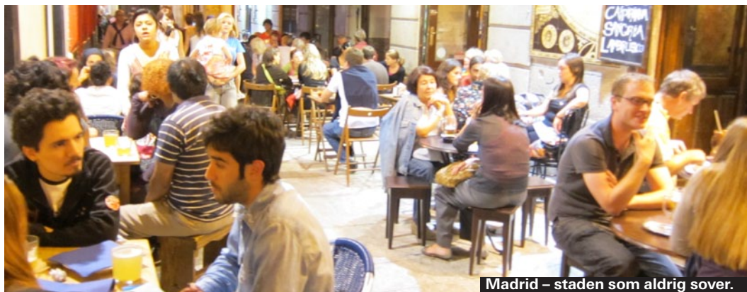
Madrid – staden som aldrig sover.