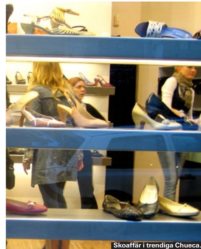
Skoaffär i trendiga Chueca.

Mandlar, nougat och spansk choklad, men också saffran, oliver och lagrad manchego-ost.