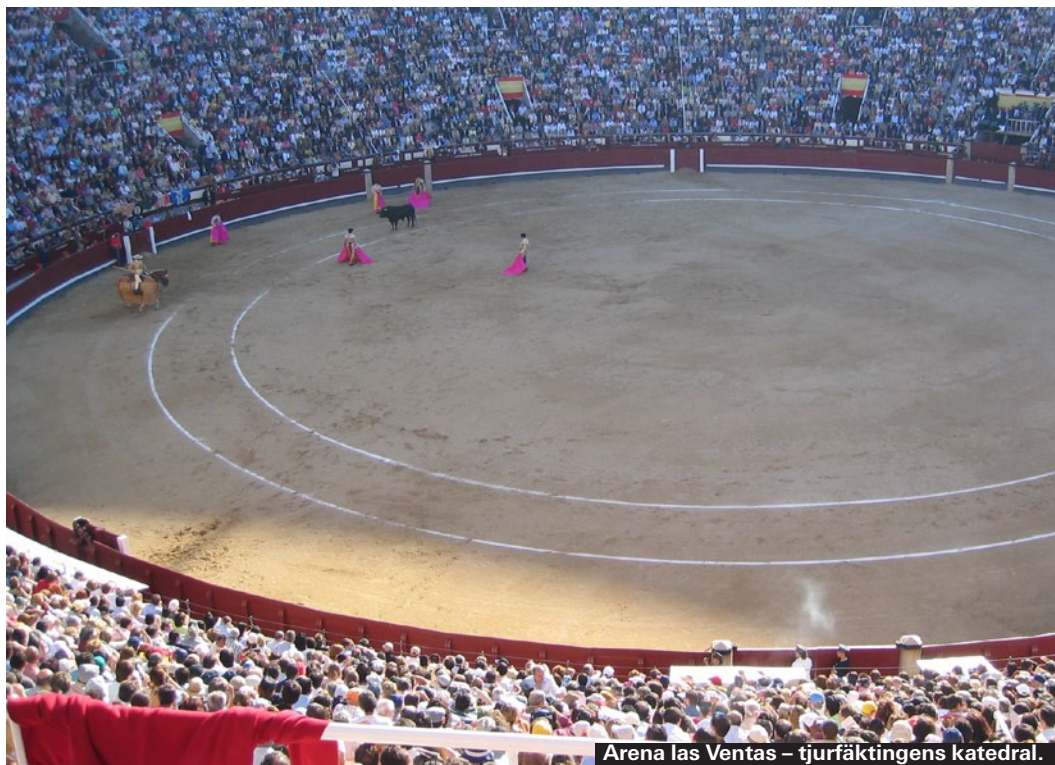
Arena las Ventas – tjurfäktingens katedral.

Höghastighetståget AVE sammanbinder Madrid med alla delar av Spanien. Hastigheten ligger på minst 350 kilometer. På bara några timmar kan man åka till Sevilla, Malaga eller Barcelona. AVE avgår från Atochas stationen som bara den är en stor upplevelse. ► www.renfe.se