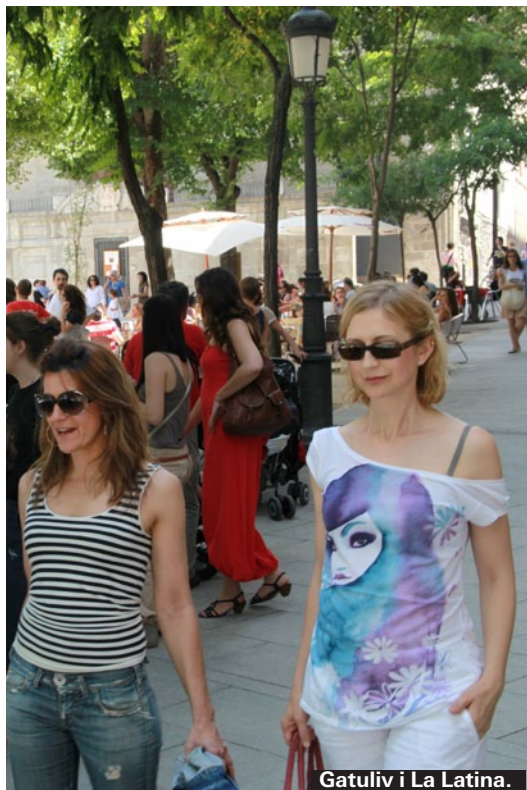
Gatuliv i La Latina.