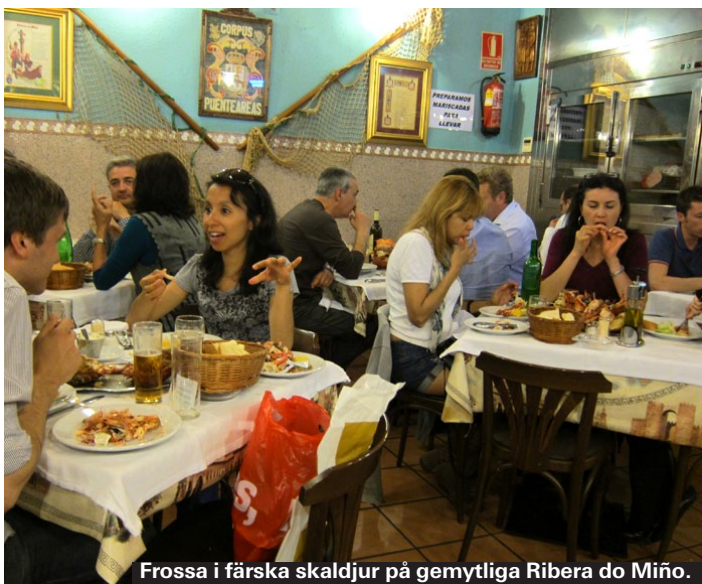
Frossa i färska skaldjur på gemytliga Ribera do Miño.

som vill ha det robust och folkligt. Att stiga in i lokalen är som att förflyttas till Galicien. Beställ en mariscada, ett överfyllt fat med skaldjur. Stängt måndagar, då finns inte färska skaldjur.