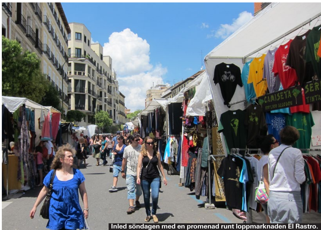
Inled söndagen med en promenad runt loppmarknaden El Rastro.