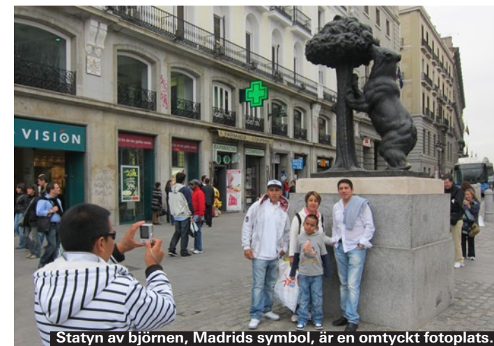
Statyn av björnen, Madrids symbol, är en omtyckt fotoplats.