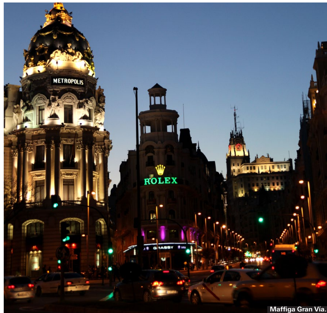
Maffiga Gran Vía.

Att gå från bar till bar för att provsmaka tapasspecialiteter är madridbornas käraste fritidssysselsättning. Vid sidan av de traditionella spanska tapasbarerna finns numera också gastrobarer