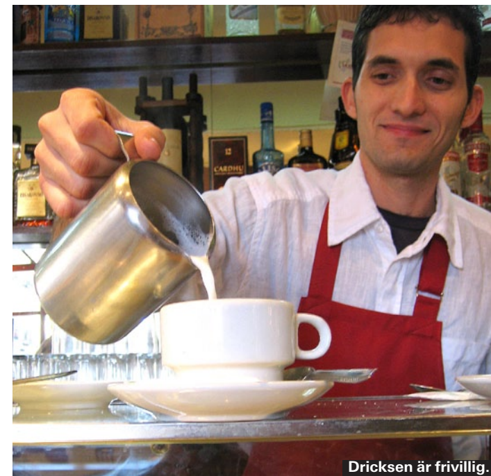
Dricksen är frivillig.

Som i Sverige ingår serviceavgiften i notan och dricksen är frivillig och ges beroende på bemötande. Vid festlig middag räcker en euro per person, lyxiga middagar lite mer. Taxiföraren