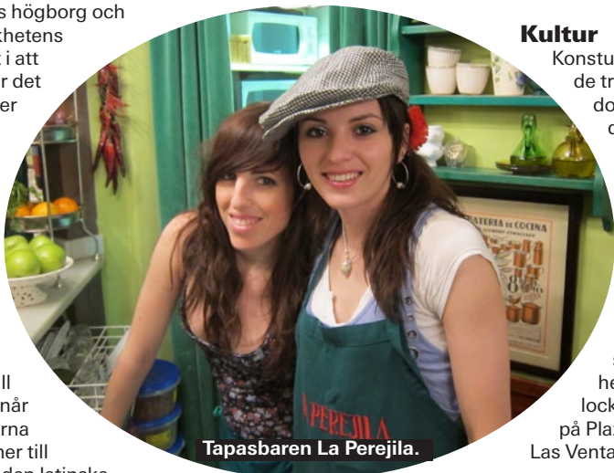
Tapasbaren La Perejila.

Madrid är staden som aldrig sover. Här finns kaféer, barer, diskotek och klubbar för alla smaker samt flamencoklubbar och salsa för den som så önskar.