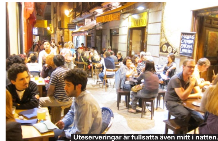
Uteserveringar är fullsatta även mitt i natten.

Ligger vid de livliga Santa Ana-kvarteren, en liten enkel lokal