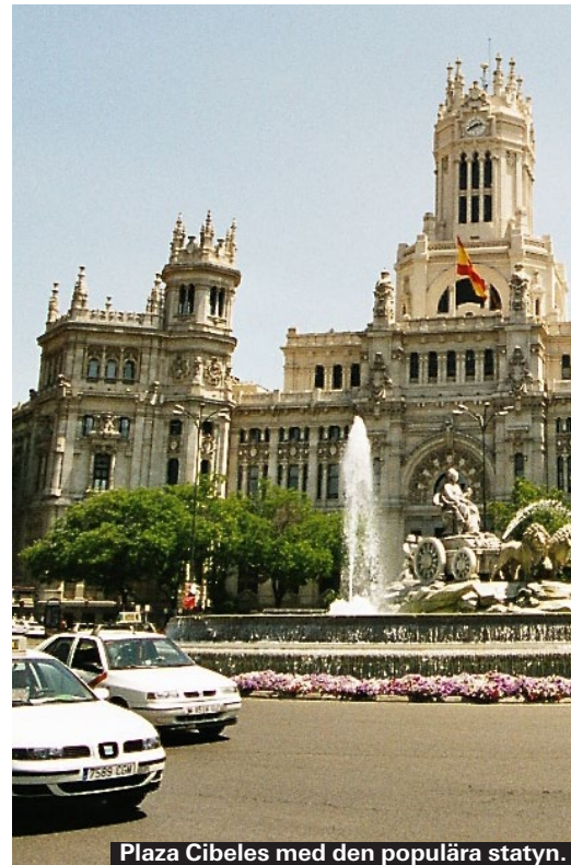
Plaza Cibeles med den populära statyn.