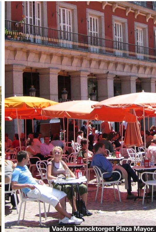
Vackra barocktorget Plaza Mayor.