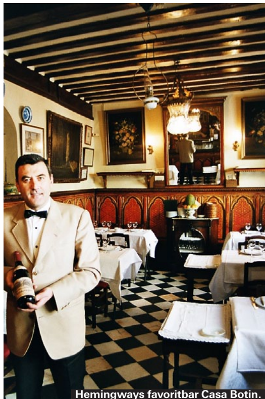
Hemingways favoritbar Casa Botin.