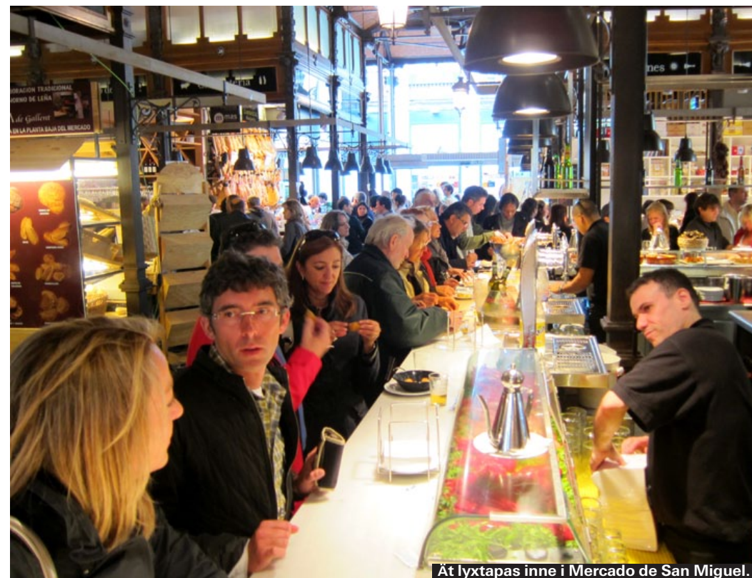
Ät lyxtapas inne i Mercado de San Miguel.