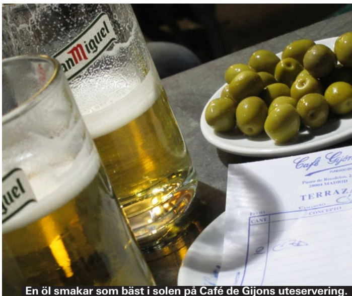
En öl smakar som bäst i solen på Café de Gijóns uteservering.

Oskalade färska räkor som doppas i olivolja och grovsalt för att